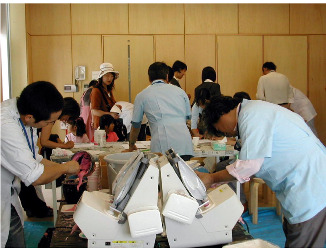
皆さん大忙しです

手形取りの工房に案内とスタンプがもらえない仕組みになっていました。その為2・40頃には200名を越す手形が取れた。そのころから天気が悪くなり凄まじい雨が当分止まなかった。終わり頃になると衛生士学科の生徒たちが自分の手形を自分で印象したりして、いつも男ばかりの汗臭い世界からちよとだけ和気藹々とした楽しい時間が過ごせたような気がした。