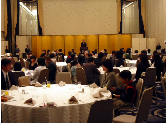
神戸支部総会、謝恩會

去る4月24日(日)新神戸オリエンタルホテルにて、約30名の参加を頂き、平成17年度神戸支部総会が行われました。役員任期満了による改選が行われ、会長1名、監事2名の推薦立候補があり、承認されました。また総会後、同ホテルにて謝恩會(たまには、みんなで謝恩會)を、開催